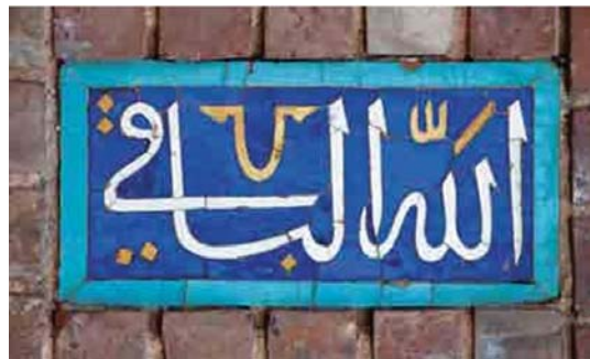
تصویر ۴. عبارت اعظم «الله الباقی» پرتعدادترین کتیبه مسجد گوه‌رشاد، مأخذ: همان.

اسماء الحسنی نگارش یافته بر این کتیبه‌های ترنجی شکل عبارت‌اند از: «یا حیان، یا مقرب، یا عالی، یا جبار، یا مرضی، یا مخفی، یا محی، یا سامع، یا منصور، یا ممان، یا رضوان، یا باقی، یا حکیم، یا رحمان، یا قوی، یا علیم، یا رادع، یا رشید، یا دود، یا دیان، یا رحیم، یا وهاب، یا هادی، یا سبحان، یا جنان، یا برهان، یا مبین، یا علی، یا ماجد، یا نور، یا هو، یا محمد، یا جواد» (همان). مجموع این اسامی الهی در دعایی به‌نام جوشن کبیر وجود دارد و شیعیان قرائت آن را در شبهای قدر از افضل اعمال می‌دانند. در عقب‌نشینی دهانه ایوان مقصوره، دو قاب کتیبه‌ای در دو طرف ایوان قرار دارند که به لحاظ ترکیب خط و متن احتمالاً از کارهای بایسنغر بن شاهرخ به شمار می‌روند (صحراگرد، ۱۳۹۲: ۱۶۹). بر پایه غربی ایوان به خط ثلث: «سبحان ربی العظیم و بحمده» و به خط کوفی «لا حول و لا قوة الا بالله العلی العظیم» و بر پایه شرقی: «سبحان ربی الاعلی و بحمده» و به خط کوفی: «سبحان الله و الحمد لله و الله اکبر» آمده