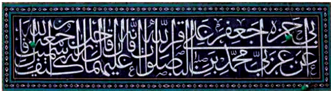
تصویر ۹. کتیبه با مضمون حدیث از امام محمد باقر (ع)، مأخذ: همان.

۱. برای آشنایی با کاتبان و دوره‌های بازنویسی کتیبه سراسری دور صحن نک: صحراگرد، ۱۳۹۲: ۱۵۹-۱۴۸.