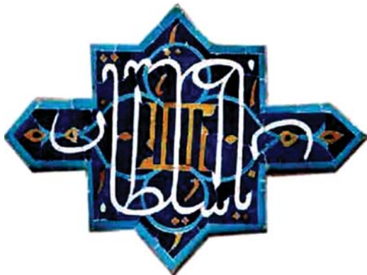
تصویر ۸. عبارت متقارن یاسلطان با تکرار وارونه ی‌الله.

غربی دو کتیبه وجود دارد که متن یکی از آنها در ادامه دیگری آمده و بنابر ماده تاریخ ۱۰۸۴ ق منسوب به دوره صفوی و خط محمدرضا امامی هستند (صحراگرد، ۱۳۹۲: ۱۶۴). این دو کتیبه با خط ثلث به حدیثی از امام محمد باقر (ع) به وجه تسمیه روز جمعه اشاره دارد. کتابت این حدیث، علاوه بر اینکه متناسب با مکان برگزاری نماز جمعه در عصر صفوی در این مکان مقدس است، اشاره‌ای است صریح به نام امام پنجم شیعیان که در بستر فکری و اعتقادی آن دوره برای نخستین بار ظهور مشخص دارد (تصویر ۹). در مرکز تزیینات هندسی صورت گرفته بر دیوار ایوان شمالی چهار کتیبه شمسه‌مانند در دو لوح محرابی بزرگ وجود دارند که در دو طرف در ورودی دارالسیاده نصب شده‌اند و پیرامون آنها با نقوش هندسی به رنگ‌های زرد و سبز و لاجوردی تزیین یافته است. این لوح کتیبه‌ها با استناد به کتیبه احداثیه بالای آن متعلق به دوره شاه عباس اول بوده و تاریخ احتمالی ۱۰۰۸ ق دارد (همان: ۱۲۶). متن این کتیبه‌ها صلوات جامع بر چهارده معصوم است که در دو کتیبه بالایی هر دو سمت ایوان آمده است: «اللهم صل علی النبی و الوصی و البتول و السبطین و السجاده و الباقر»؛ و در دو کتیبه پایین عبارت: «و الصادق و الکاظم و الرضی